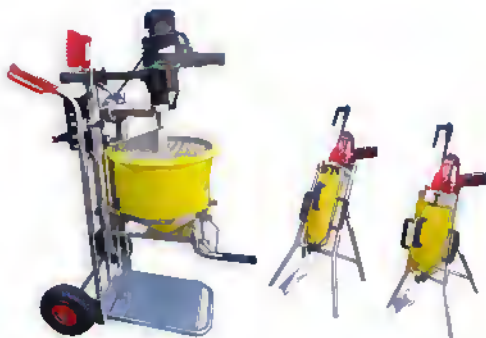
MortelTapMenger & MortelSpuiten