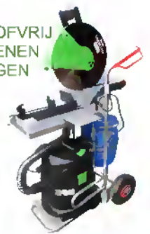
DroogZaagZuigCombi Met stofVoorAfscheider